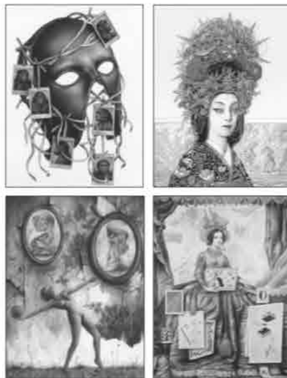
Øverst fra venstre: Mask/Primates, Emerald Eyes/Thelema, Riefenthal/Dwarfs, og Architect.

Det som ofte er interessant med kunst er at den tillater motstridigheter og gir oss lov til å vedgå selvmodsigelser. I det virkelige livet blir det påkrevd at vi opptrer tydelige og konsistente i offentligheten. Kunst, derimot er et frimor hvor konflikter skal kunne finnes med all sin uoppgjorte ambivalens. Jeg synes det er interessant å sjonglere med kontrære ytterpunkter og elastisk tøyde rådende motsetninger som vakkert/stygt, tro-skyldig/perverst, rent/skiltent og så videre. Det handler for meg om å komme